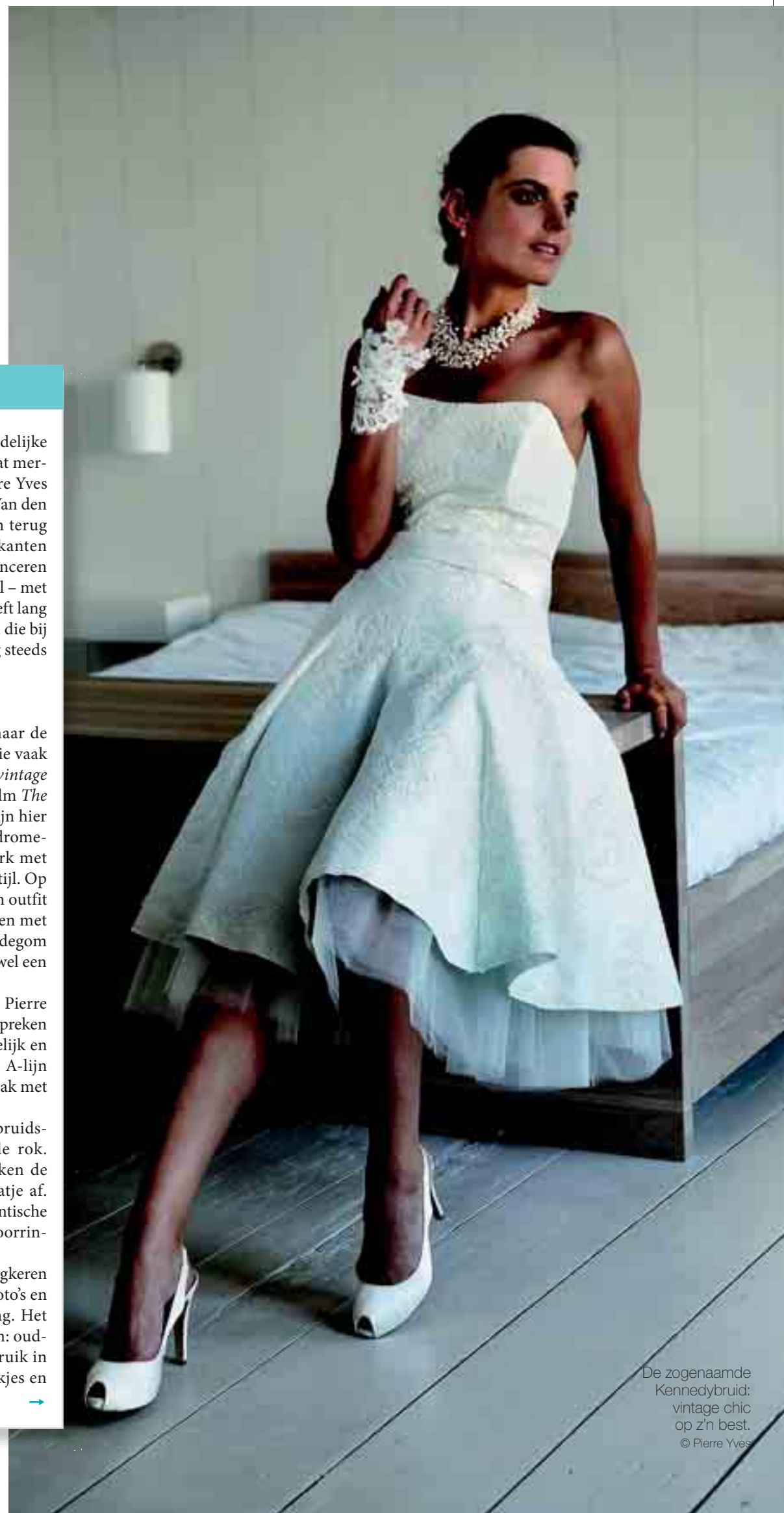
De zogenaamde Kennedybruid: vintage chic op z'n best.

Uiteraard kan je het thema laten terugkeren in alle aspecten van het feest: retrofoto's en -uitnodiging, aangepaste verlichting. Het kleurenpalet is wit met een toets erin: oud-rose, lichtpaars, pastelleuren. Gebruik in de decoratie veel glas, kaarsen, strikjes en bloemen.